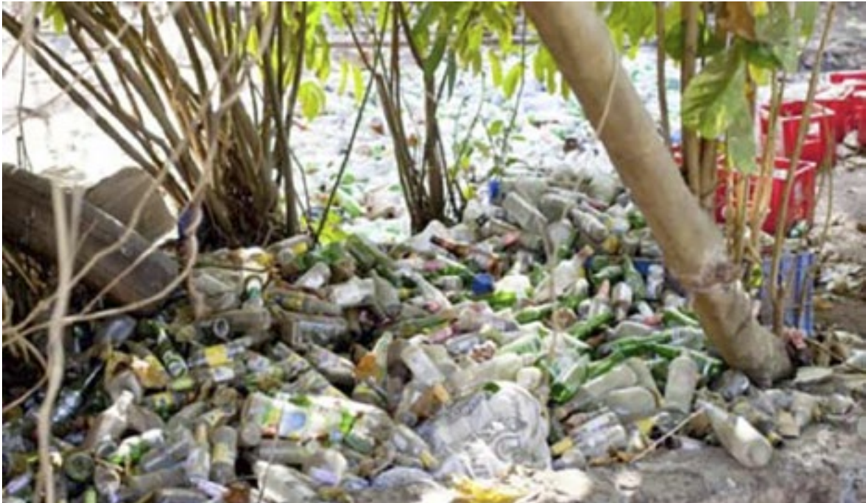
Plastic flessen in in Goa, India.

Die opvallende uitspraak komt van het Indiase Hooggerechtshof in India.