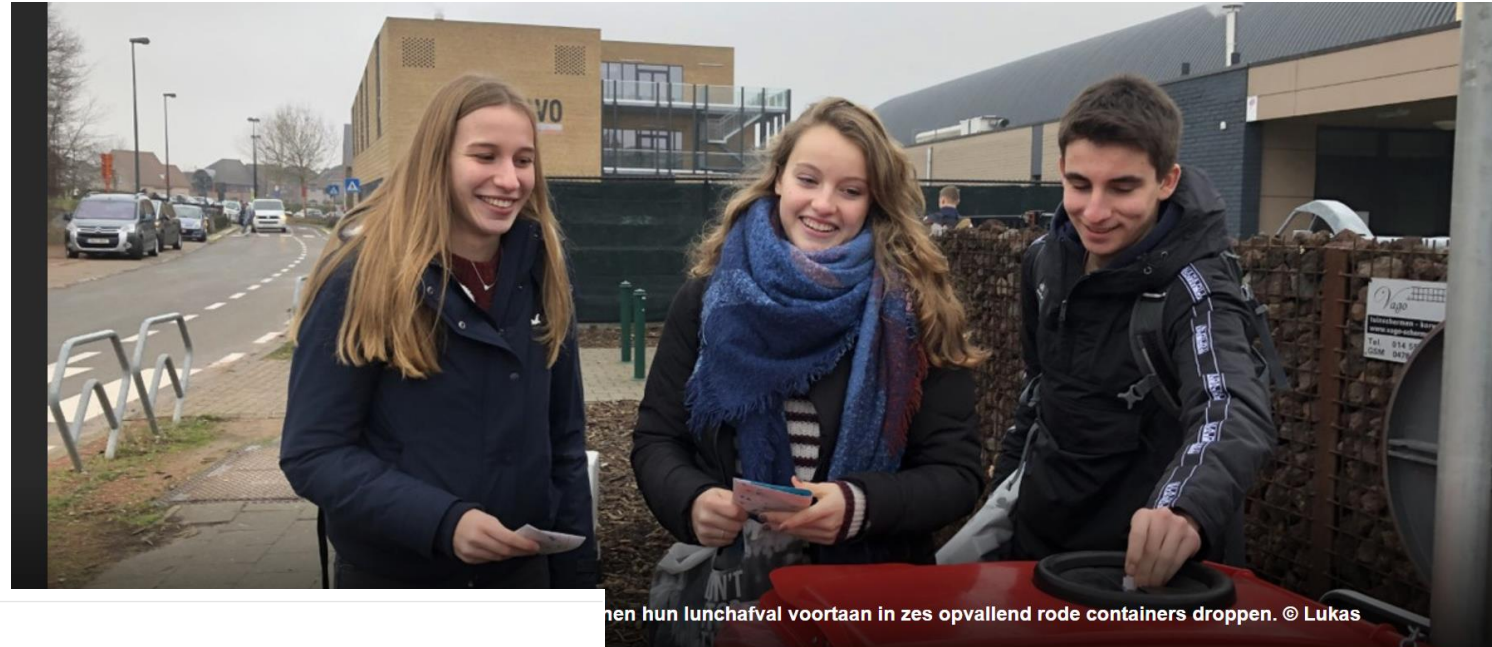
...nen hun lunchafval voortaan in zes opvallend rode containers droppen.

(Digitale) communicatie bij lokale handelaars