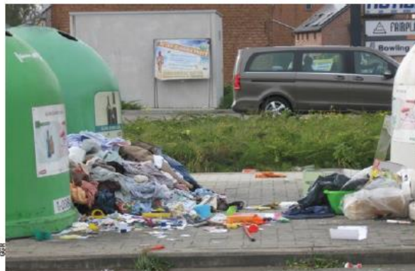
■ De glasbolsite langs de Pleinstraat had altijd al te kampen met sluikstorten.