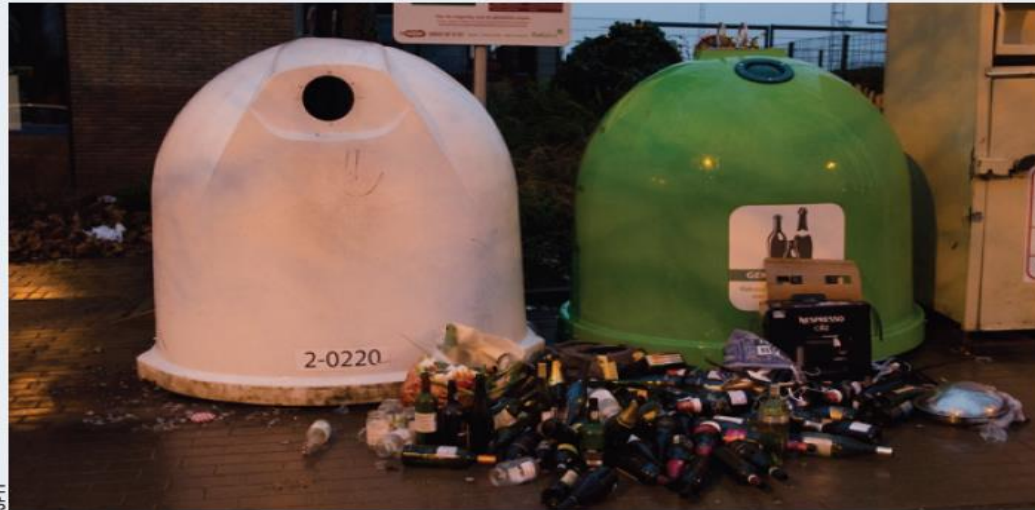
■ Na de feestdagen lag de glasbolsite aan de sporthal van Kessel-Lo er zo bij.

De camera's moeten potentiële sluijstorters afschrikken. "We zullen aan de problematische glasbolsites camera's plaatsen op plekken waar ze niet meteen zichtbaar zijn, maar wel met een bord aangeven dat de camera's er hangen. Daarnaast zullen de beelden opgenomen worden en bekeken worden door een bevoegde ambtenaar die samen met de politie een GAS-boete zal uitschrijven. Deze twee zaken zullen een afschrikkeffect teweegbrengen", zegt woordvoerder Jos Artois van Ecowerf. Naast Leuven doen