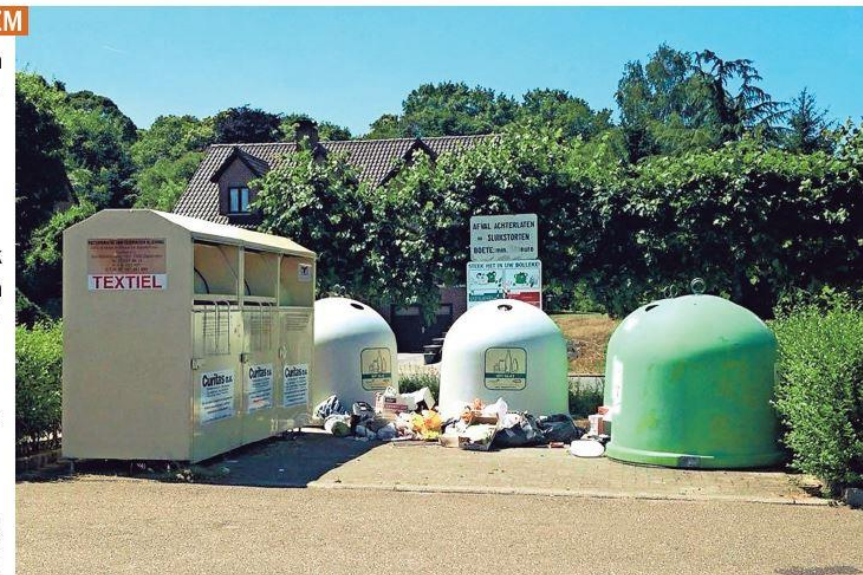
Om sluikstort aan glasbollen tegen te gaan worden voortaan mobiele camera's ingezet.

Om sluikstorten bij glasbollen tegen te gaan, begon Ecowerf vorig jaar het proefproject van camerabewaking. De intercommunale koopt een aantal camera's en laat ze circuleren onder de deelnemende gemeenten. Naast Scherpenheuvel-Zichem zijn dat Bekkevoort, Begijnendijk, Boortmeerbeek, Leuven en Tienen. Zij huren de camera's aan 539 euro per week. In september worden de toestellen verdeeld. «Zezullen zichtbaar opgesteld staan, met een aanduiding dat er gefilmd wordt. Ze blijven er niet permanent. Drie of vier keer per jaar kunnen we erover beschikken en ze blijven telkens enkele weken hangen», zegt burgemeester Manu Claes (CD&V). De vier uitgekozen plaatsen zijn de Molenaarstraat (parking naast het kerkhof), Prins Alexanderstraat (vlakbij jeugdhuis 't Boemelke), de Koestraat (aan