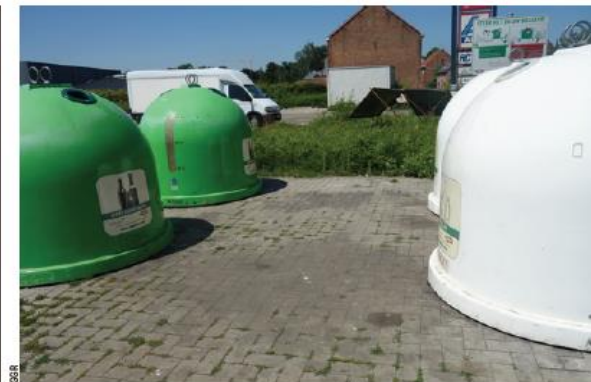
■ De site wordt elke week opgeruimd.