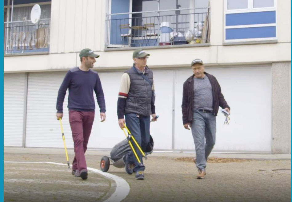
Voorbeeld: De Flatwachers